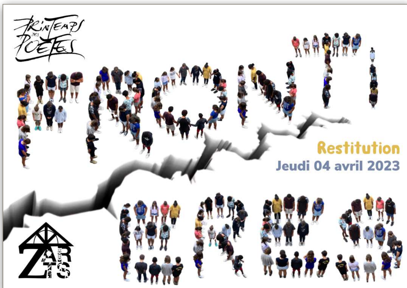
Affiche réalisée par les élèves d'arts visuels du niveau 2