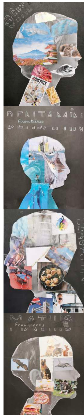
Portraits réalisés par les élèves d'arts visuels du niveau 1