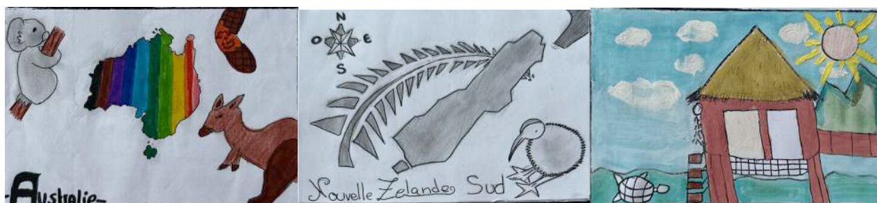
Cartes postales réalisées par les élèves d'arts visuels du niveau 2